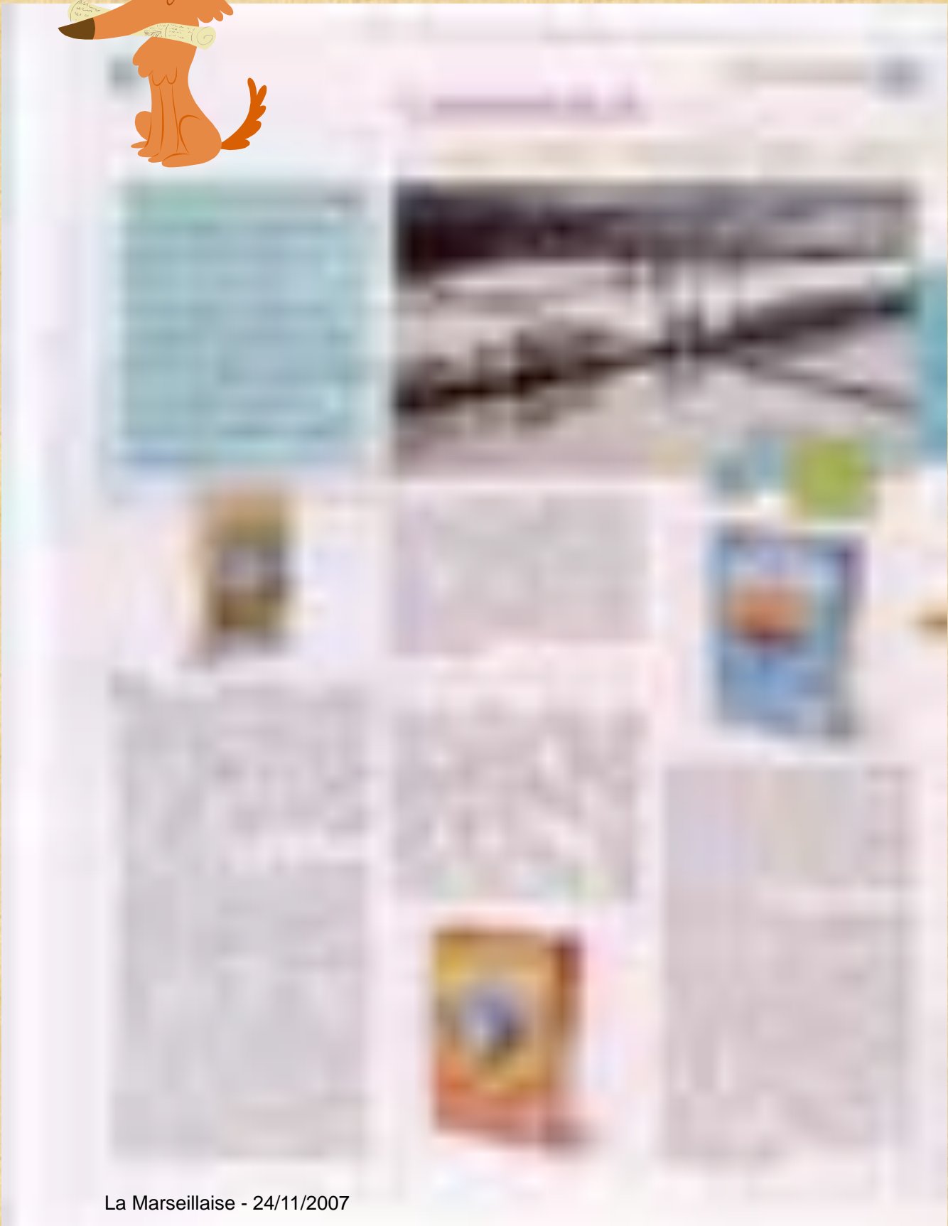
La Marseillaise - 24/11/2007